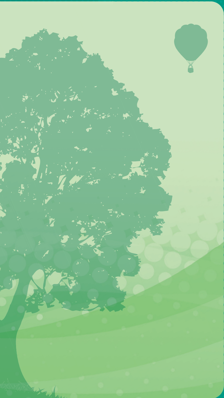
図 書 目 録